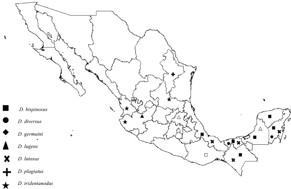
Figura 3. Mapa de distribución de las especies conocidas de Dolichoderus en México. Símbolos oscuros, localidades conocidas; símbolos claros, registros nuevos.